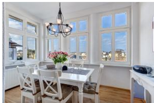
Essplatz in der Veranda mit schönem Ausblick

Geräumige helle 4-Zimmer-Wohnung mit Veranda Richtung Ostsee - mit schönem weitem Blick! Die Wohnung ist gemütlich und freundlich eingerichtet und ausgestattet. Sie wurde 2014 renoviert, die Bäder und Küche sind dann neu gemacht worden. Die Wohnung verfügt über drei separate Schlafzimmer, Wohnzimmer mit Küchenecke und Essplatz in der Veranda, ein Bad mit Wanne und Dusche, ein kleines Duschbad und einen Eingangsflur mit Garderobe. Die Wohnung verfügt über einen großen Balkon mit Esstisch. Zur Wohnung gehört ein kostenfreier Pkw-Stellplatz auf dem Grundstück. Ein zweiter kann hinzugemietet werden. Die Villa Margarete steht etwas erhöht in der Bergstraße, wodurch sich der weite Blick ergibt. Die Wohnung befindet sich im I. OG, etwa 300m zur Strandpromenade. Von der Villa Margarete aus können Sie das Ortszentrum und die bekannte Ahlbecker Seebrücke in ca. 8-10 Minuten zu Fuß erreichen.