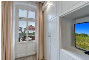
Flachbildfernseher im Schlafzimmer