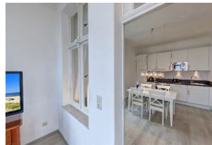
Blick in die Wohnküche