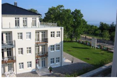
Hausansicht "Villa Aquamarina" von der Südseite