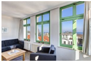
Wohnen / Seeblick aus der Veranda