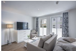
Flachbild TV und Couch