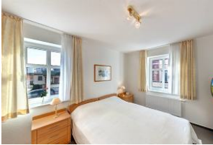
Schlafzimmer mit Fernseher