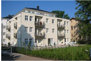
Hausansicht "Villa Aquamarina" von der Promenade mit Garten und Terrassen