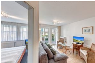
Türe zum Schlafzimmer