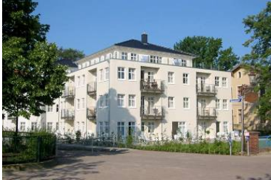
Hausansicht "Villa Aquamarina" von der Promenade