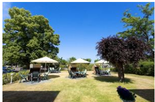
Garten mit Terrassen und Strandkörben (Mai bis September)